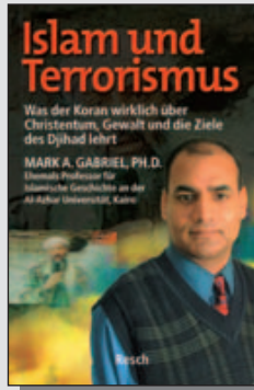
Gabriel Mark A. (Resch) Pb., 272 Seiten CHF 25.40, € 14.90 Best.-Nr. 673739

Religionsfreiheit/Staatsform islamisch 65,2 Mio. Einwohner, 90 % Muslime Behinderung von Versammlungen/ Diakonie/Mission, bis zu schwersten Verletzungen religiöser Grundfreiheit