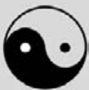
Abb. 2 Yin und Yang, ein Zeichen aus dem Taoismus: männlich und weiblich vereint.